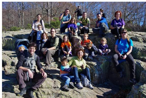
Participants de la sortida del mes de novembre al Montseny.

14 de febrer a la serra d'Ataix ( 15 minuts en cotxe des de Sant Vicenç)